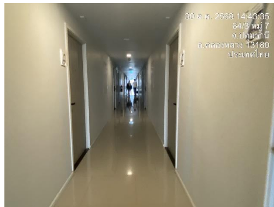
ภาพที่ 1.2-2 สภาพปัจจุบันโครงการ